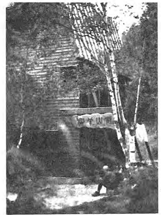
〈神戸大学鹿島体育所(翔羊山荘)〉