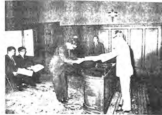
< 9月17日学位記授与式 >