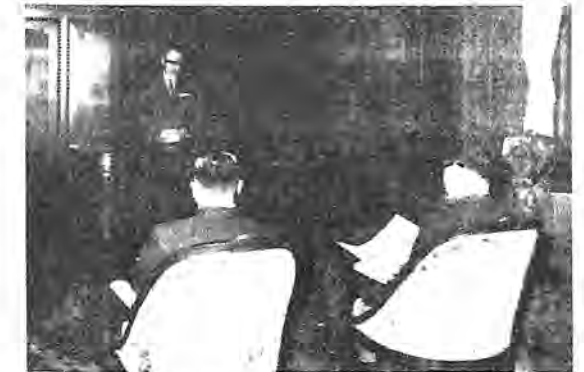
< 10月1日学位記授与式 >

さる9月17日(水) および10月1日(水) の両日午前10時より貴賓室において学位記授与式が行なわれた。