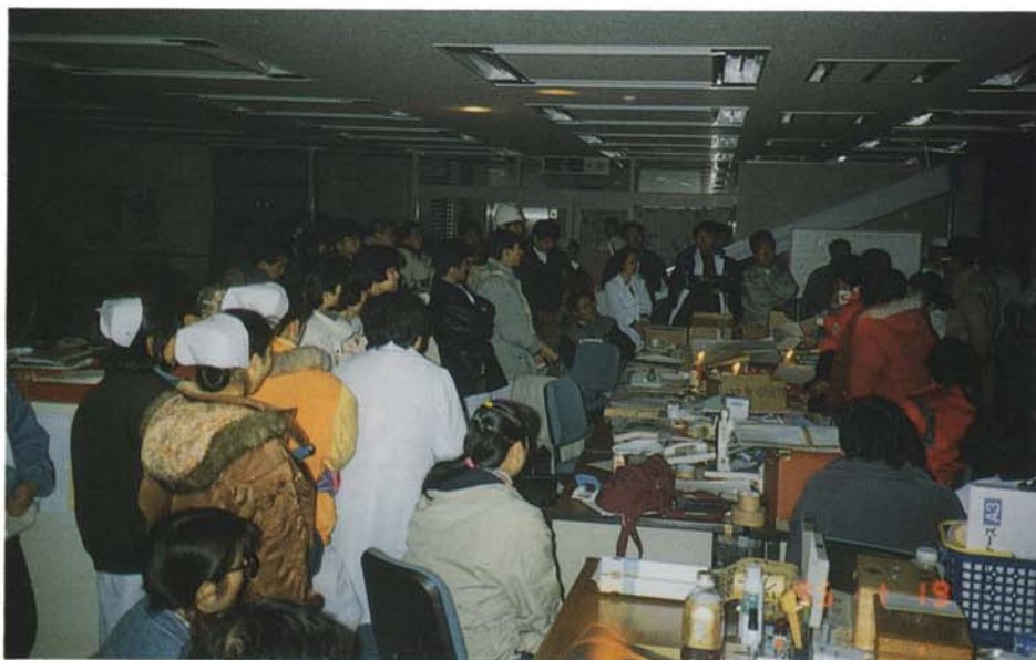
停電の中、行われる 救護班全体ミーティング (1月19日、長田保健所)