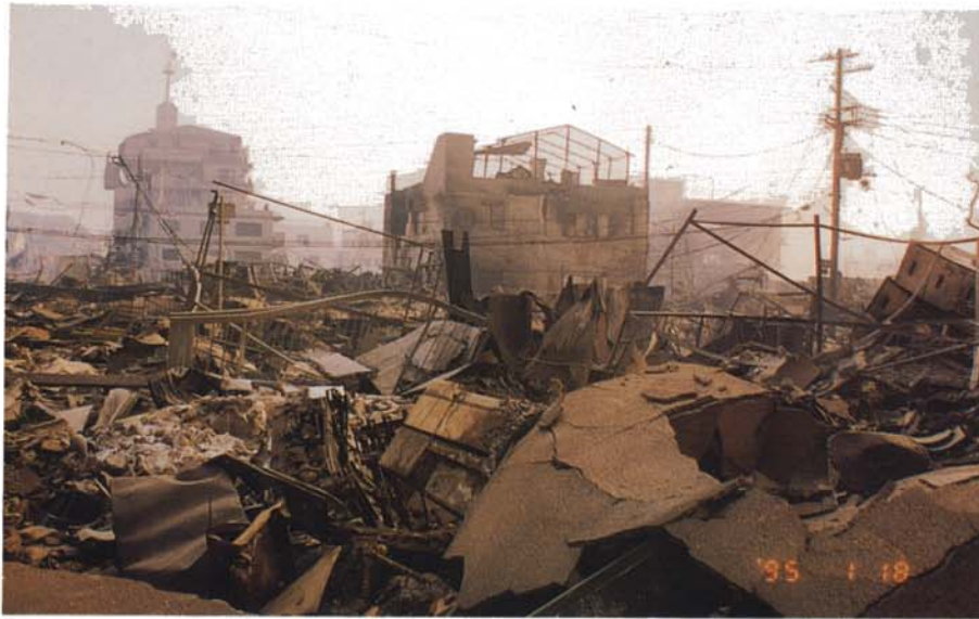
焼け野原となった市街地 (1月18日、兵庫区)