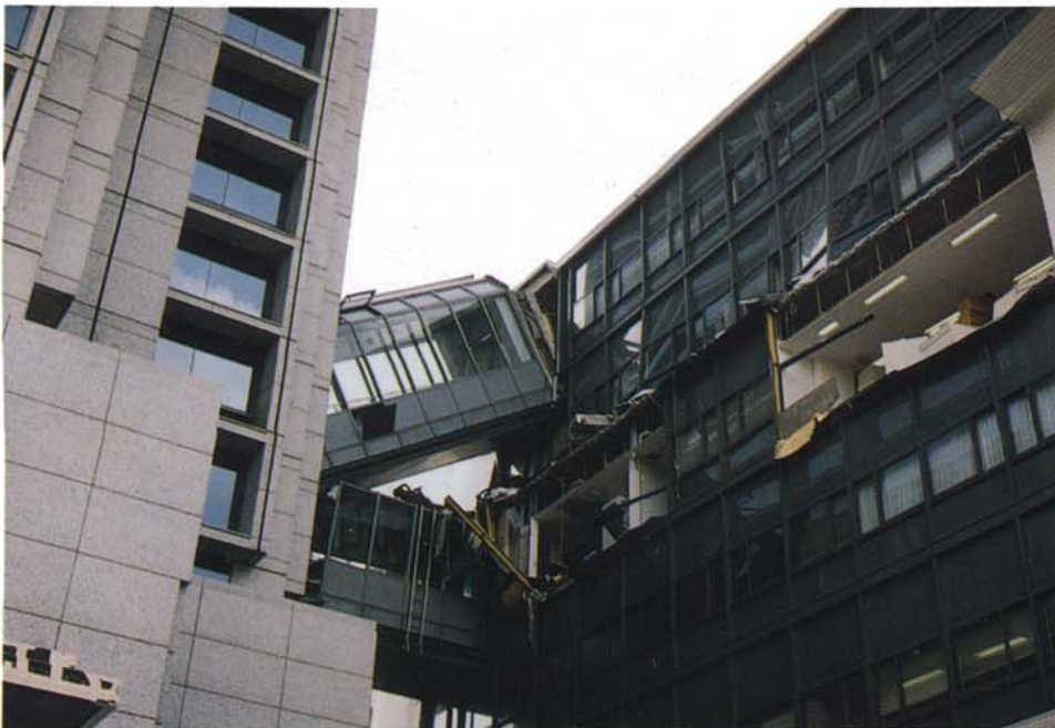
崩壊した神戸市役所庁舎 (左・1号館、右2号館) (1月18日、中央区加納町)