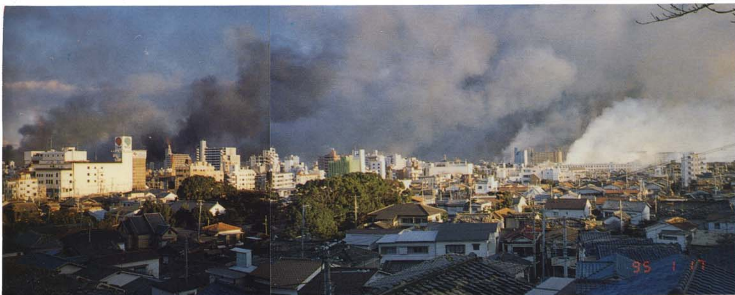
板宿山手より須磨区内をのぞむ (1月17日)