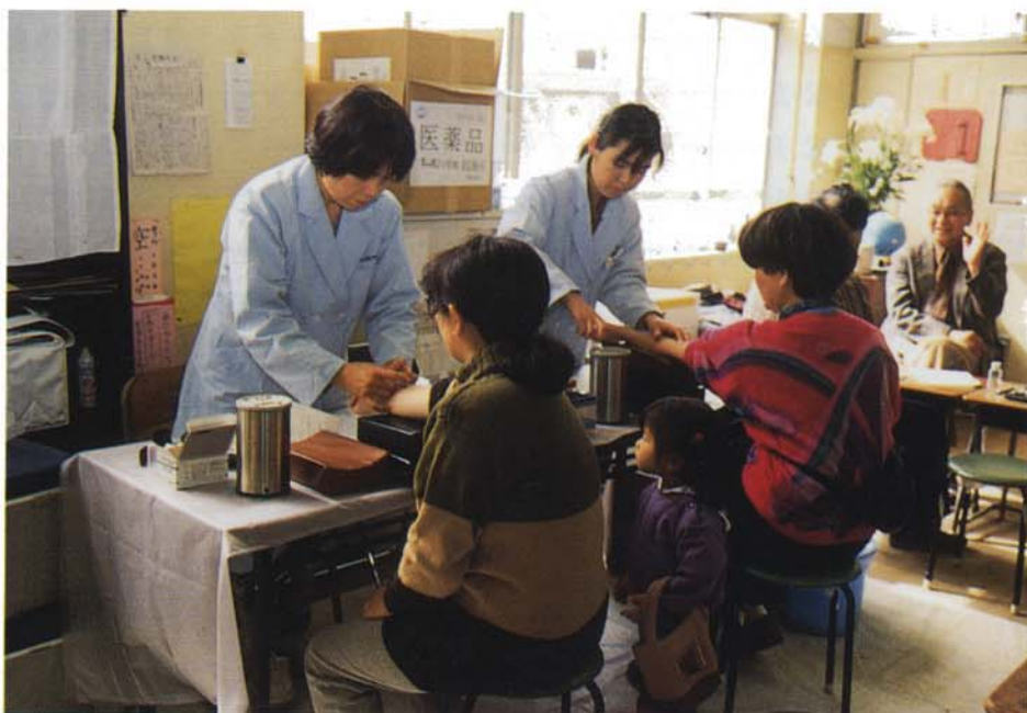
東灘保健所による住民健診 (3月26日、東灘区本山第2小学校)