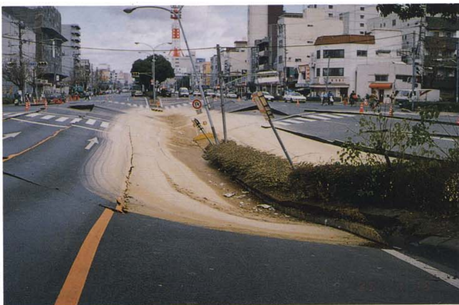
陥没した道路、道路下は高速大開駅 (1月19日、兵庫区水木通)