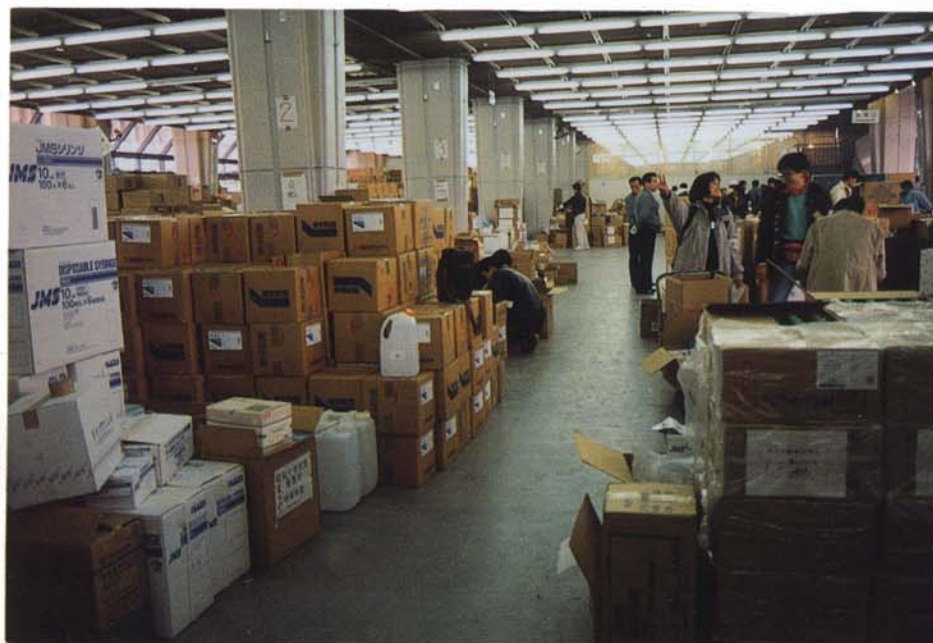
救援医薬品集積センター 産業貿易展示場(サンボーホール) (1月26日、中央区)