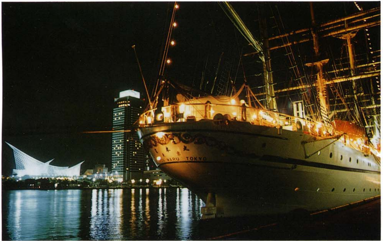
神戸港夜景（震災後初めて入港した日本丸、6月16日）