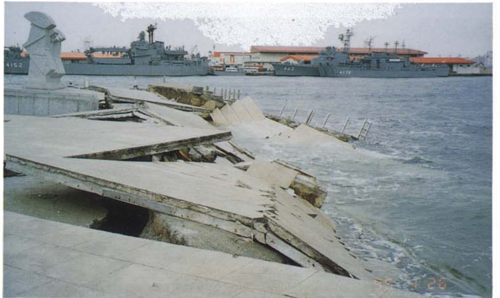
メリケンパーク (1月18日、中央区)