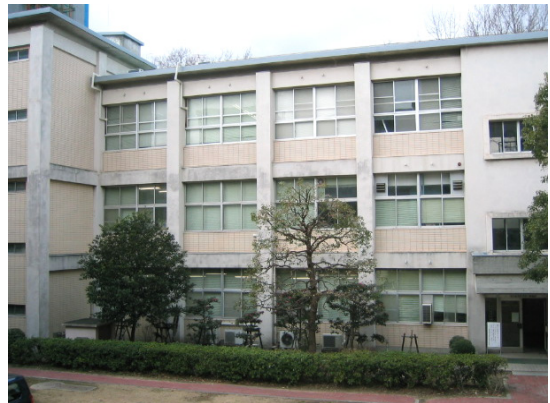
(研究所新館玄関前から5層の書庫を望む)

*書庫に入る手続きは不要ですが、持ち込むことができるのは貴重品・筆記用具のみです。備付のロッカーをご利用ください。