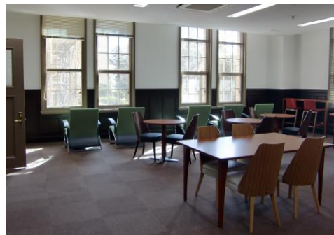
1 階奥のリフレッシュルーム