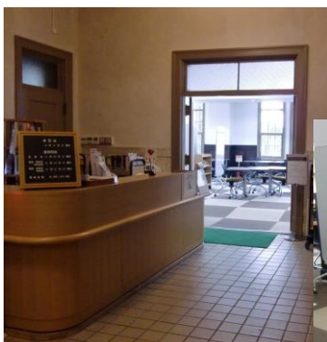
メインカウンター横が ラーニング commons に

昨年 9 月より長らくご迷惑をおかけしておりましたが、耐震改修工事もようやく完了しオープンしました。皆様のご利用をお待ちしています。