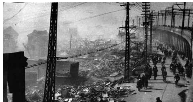
写真1 元町駅より撮影、1945（昭和20）年3月17日の空襲に焦土と化した神戸元町三丁目付近。一右は省線高架線

神戸のヤミ市は、三宮から元町を西へ越えて神戸駅まで続く高架下を中心に位置した。その周辺にも正規の商店街や小売店舗群がみられ、組織化に際した取りまとめ集団がそれぞれを統括した。民族団体が基盤となった商業組合は、1945年12月28日に朝鮮人連盟を基盤として結成された「朝鮮人自由商人連合会」や、1946年5月14日に台湾省民会を基盤として結成された「国際総商組合」が