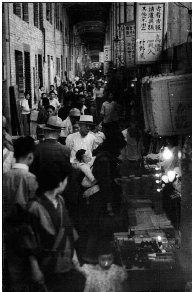
写真4 1947年6月撮影、三宮高架線下の自由市場

1947年12月時点では、省線三ノ宮駅から元町駅を経て神戸駅に至る高架下商店街は古着屋や飲食店など1300店を数え、「港都の美観、道路独占禁止法あるいはヤミの温床などの理由」によって立退き命令を受けながらも延期を重ねていた 35) 。1947年12月末日をもって高架下敷地の賃貸契約と露店営業取締令の期限が切れることから、高架下商店街の今後が問題化した。しかし、新たな取締令を設けずに統制違反と衛生面から取締継続と県保安課長の方針