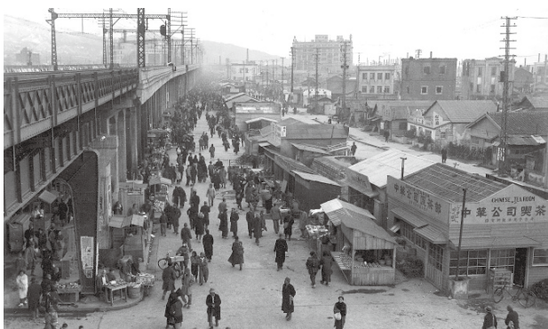
写真2 1946年初頭、鯉川筋ガード付近より東方、三宮方面を眺める。省線元町駅から三ノ宮駅にかけての高架橋南側路上、緑地帯上にはブラック店舗群が見られる。

代表的であった 17) 。また、「神農会」や「露友会」といった戦前から続く露天商の自治組織はいちはやく復興に乗り出し、復員者や引揚者たちを新規の商人として受け入れた 18) 。