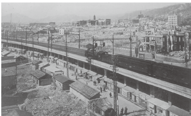
写真3 1946年4月元町駅南向きの阪神ビル屋上より進駐軍撮影、元町高架下浜側に建ち並ぶバラック店舗群（個人蔵）

そして、この改称を報じた際には、「自由市場から足を洗い本店舗として発足しようという改造案が当局の内諾を得た」との記述 32)