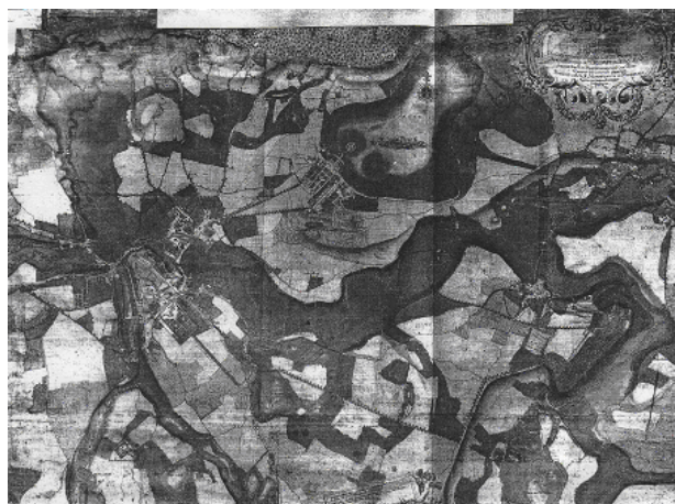
図4. 1745年当時の図絵(リーディガー・プラン)

の領邦全図(リーディガー・プラン Riediger-Plan)に様々な趣向をこらしている。このようにヨーロッパにおいて18世紀が製図の全盛期であると同時に、大量生産に向けた移行期でもあった。